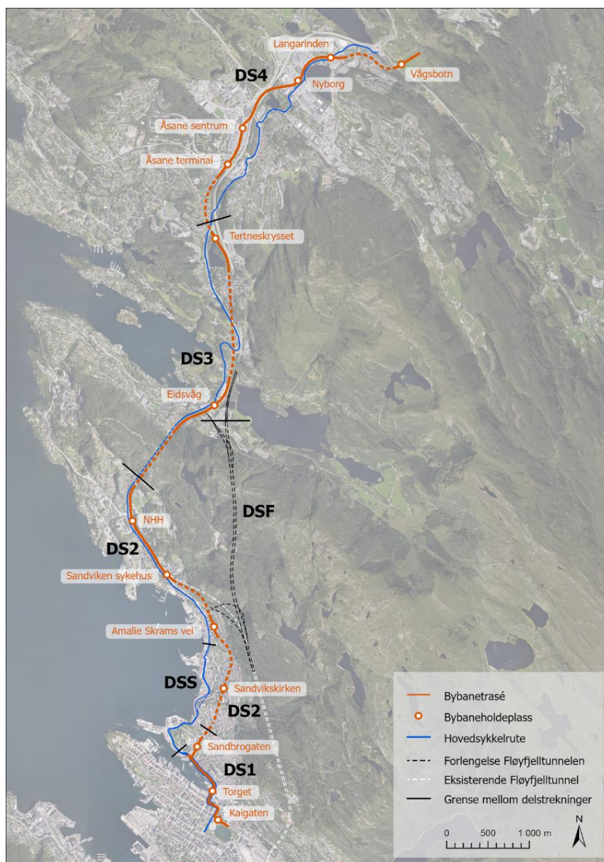
Figur 2-1: Bybane til Åsane og forlenget Fløyfjellstunnel

Bybanealternativet omfatter Bybanen og hovedsykkelrute fra Sentrum til Åsane og forlenget Fløyfjelltunnel til Eidsvåg, jf. Figur 2-1.